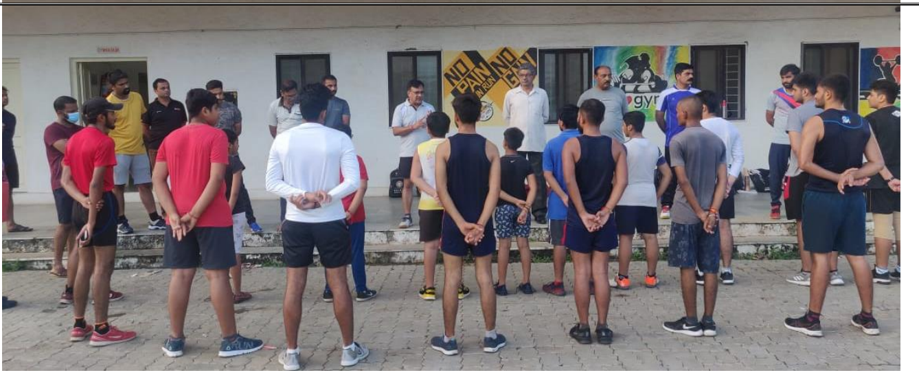
શારીરિક શિક્ષણ નિયામકશ્રી ફીટ ઇન્ડિયા ફ્રીડમ રનનું પ્રાસંગિક ઉદ્દબોધન